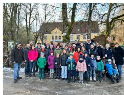
Die Wandergruppe, immer unterwegs