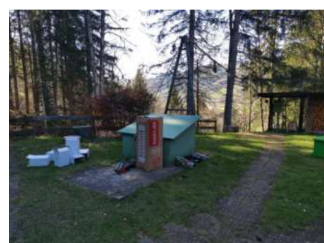
Arbeitstour 2025 – offensichtlich geht es auch mal ohne Schnee